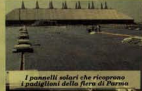
I pannelli solari che ricoprono i padiglioni della fiera di Parma

per produrre energia. La manifestazione è patrocinata dalle principali associazioni di categoria: Gifi, il Gruppo Imprese Fotovoltaiche Italiane, Isef Italia, sezione italiana dell'International Solar Energy Society, Kyoto Club, organizzazione non-profit dedicata al raggiungimento degli obiettivi dell'omonimo Protocollo, Ecoaction, associazione internazionale per la diffusione della cultura sostenibile nell'architettura contemporanea, l'Istituto Italiano del Rame, dedicata alla promozione e lo sviluppo degli impieghi del rame ed Enea, Agenzia nazionale